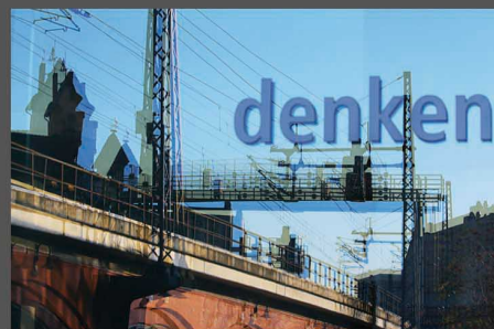
„KRANZLER ECK DENKEN“ 2015 FOTOGRAFIE GIGASEC 90 X 60 CM